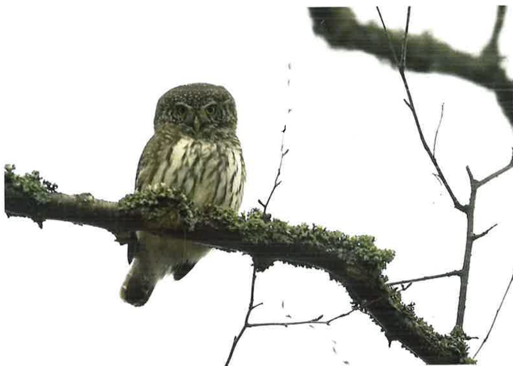
Varpuspöllö, Angelniemi 2004