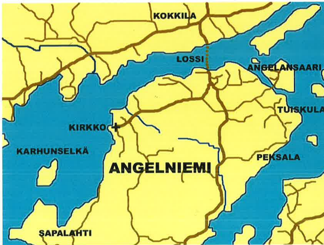
Kartta: Outi Sarjakoski

Olen tarkkaillut, laskenut ja tutkinut Angelniemen linnustoa 8.2.2000 alken, nyt noin 5.5 vuoden ajan. Syitä on kaksi: (i) olen aktiivisesti harrastanut lintujen tarkkailua ja sittemmin myös lintukuvausta jo noin 46 vuotta ja (ii) hankin alkuvuonna 2000 vapaa-ajan-asunnon Angelniemen kirkolta, keskeltä vanhaa ”kirkonkylää”. Angelniemellä olen ollut vuosittain 110-130 päivänä, tosin osa näistä on vain aamuja tai iltoja. Keväin ja syksyin olen tarkkaillut satoina aamuina lintujen muutttoa omalta laiturilta, josta aukeaa esteetön näköala Karhunselän merialueen yli Sapalahdesta Sauvon puolelle ja lähes Sauvo/Halikko-kuntarajalle. Lisäksi olen melko paljon retkeillyt Peksalassa koska Peksalan hienot ja (onneksi) pitkälti luonnontilassa olevat rantaniityt ja -pellot keräävät paljon laskeutuneita lintuja. Usein päiväretket ovat suuntautuneet myös Angelansaaren puusillan lähistölle ja vähän harvemmin Sapalahden kartanon eteläpuoleiselle niitty- ja peltoalueelle. Myös kirkon kaakkoispuolella olevaa laajaa kallio- ja suomaastoa olen kulkenut melko usein, tosin pääasiassa vain metsäteitä pitkin. Koko laajan Angelansaaren linnusto on jäänyt täysin kartoittamatta koska heti sillan takana olevan portin (joka